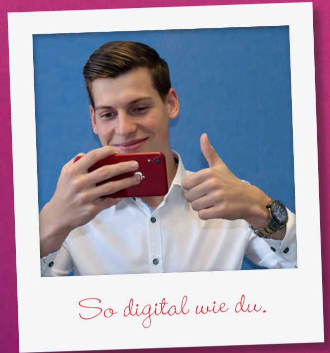
So digital wie du.