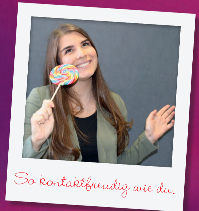
So kontaktfreudig wie du.