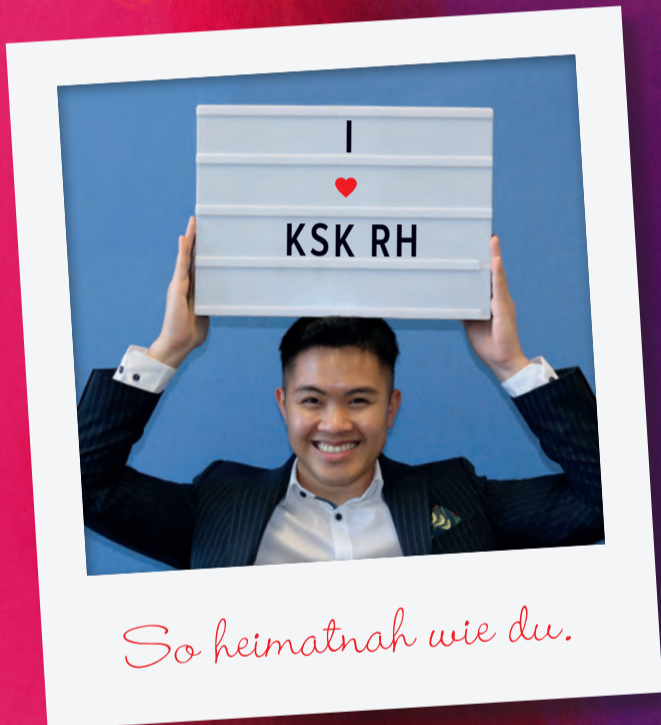
So heimatnah wie du.