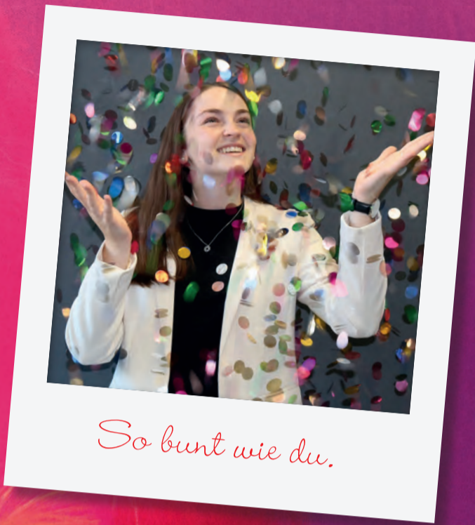
So bunt wie du.